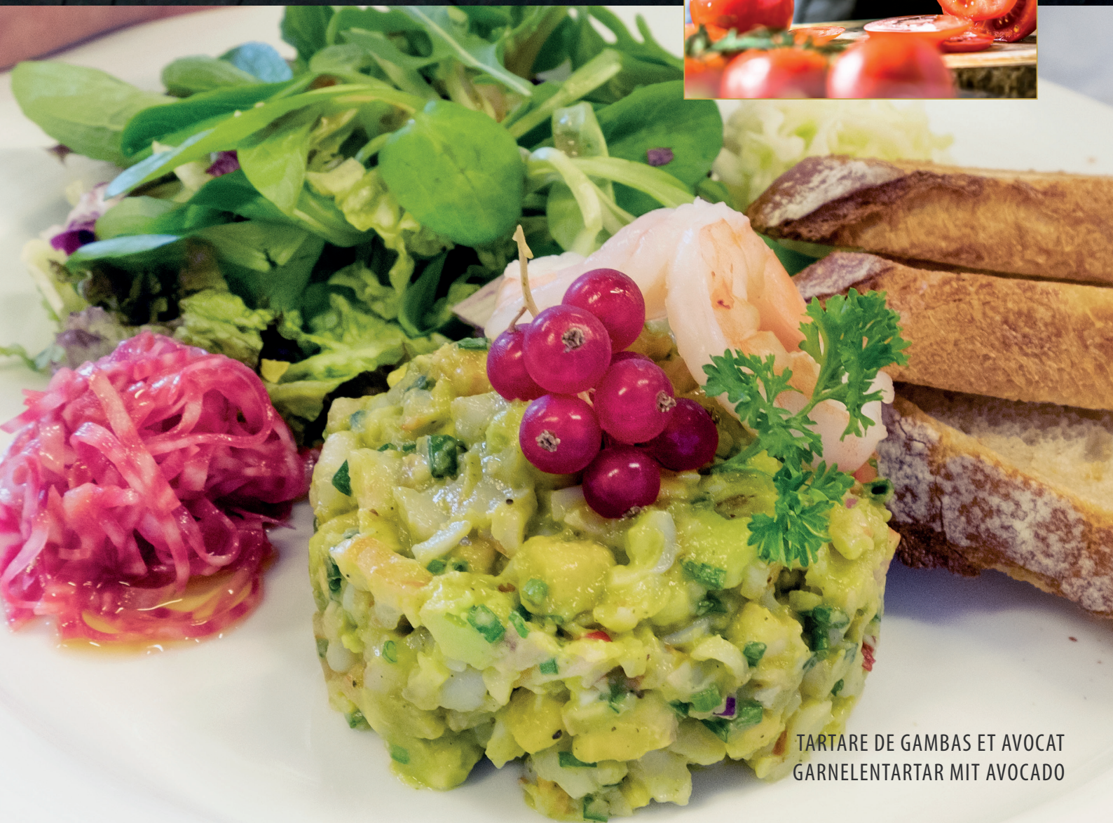
TARTARE DE GAMBAS ET AVOCAT GARNELENTARTAR MIT AVOCADO