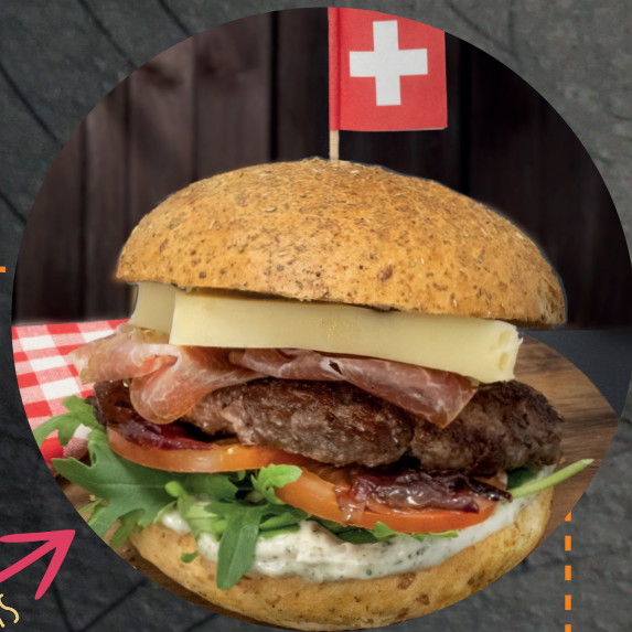
BURGER DU MOIS | DES MONATS

Poulet crispy, avocat, cheddar, pickles d'oignons rouges, salade et mayonnaise au sriracha Poulet-Crispy, Avocado, Cheddar, rote Zwiebel-Pickels, Salat und Sriracha-Mayonnaise