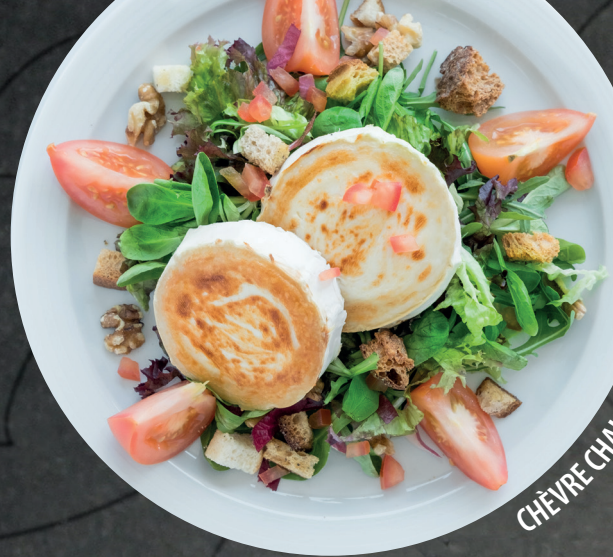
CHÈVRE CHAUD | WARMER ZIEGENKÄSE

Supplément poulet | Aufpreis mit Poulet 2.50