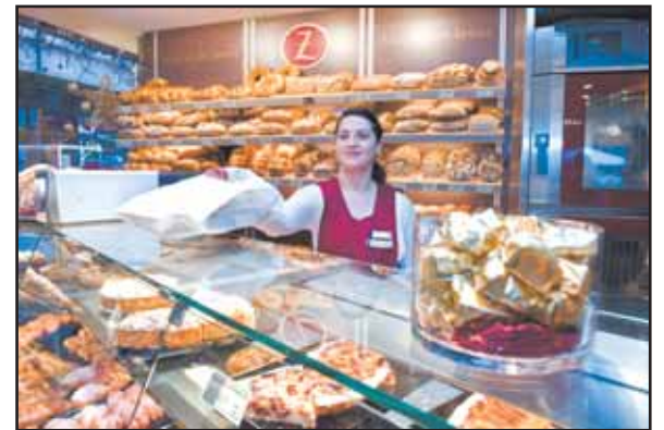
Service personnalisé et de qualité, un des atouts de l'entreprise dans ses quatre points de vente à Sion, Sierre et Grône.