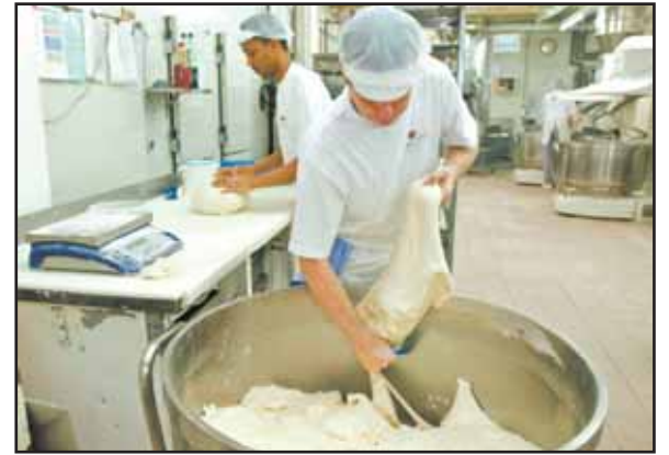
Le travail de préparation s'effectue de manière artisanale dans le laboratoire de Chandoline, à Sion.