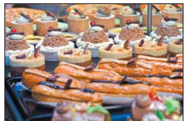
Difficile de résister à l'heure du dessert!