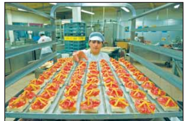
Tous les jours, 15 000 à 20 000 articles sont fabriqués chez Zenhäusern Frères S.A.