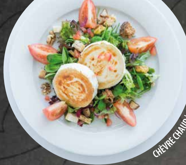
CHÈVRE CHAUD | WARMER ZIEGENKÄSE

Supplément poulet | Aufpreis mit Poulet 2.50