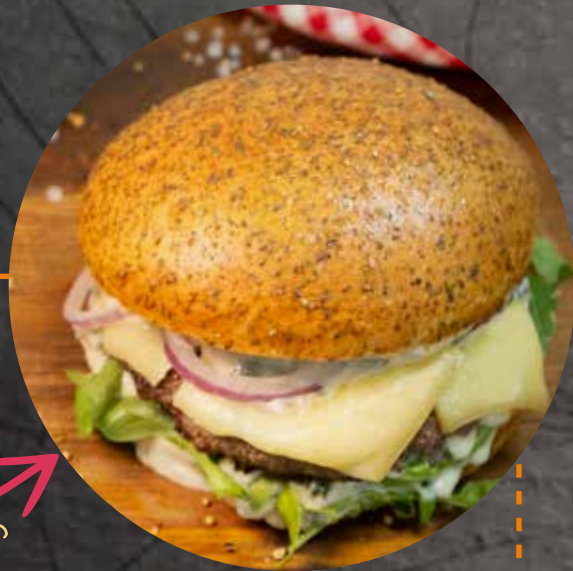
BURGER DU MOIS | DES MONATS

Bun maison à la raclette AOP Valais, bœuf, Bagnes 4, tomates, oignons, roquette, sauce miel-moutarde Hausgemachter Bun mit Walliser Raclettekäse AOP, Rindfleisch, Bagnes 4, Tomaten, Zwiebeln, Rucola, Honig-Senf-Sauce