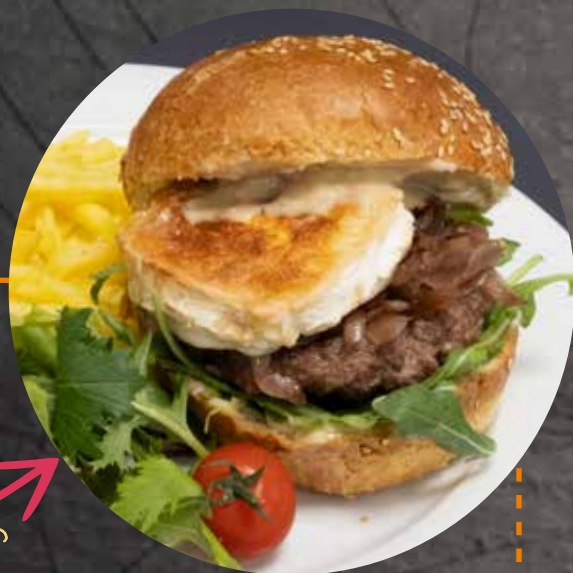
BURGER DU MOIS | DES MONATS

Bun maison à la raclette AOP Valais, bœuf, Bagnes 4, tomates, oignons, roquette, sauce miel-moutarde Hausgemachter Bun mit Walliser Raclettekäse AOP, Rindfleisch, Bagnes 4, Tomaten, Zwiebeln, Rucola, Honig-Senf-Sauce