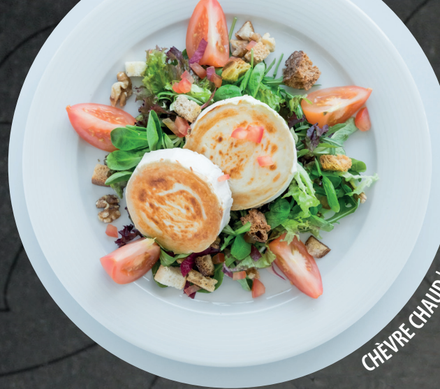
CHÈVRE CHAUD | WARMER ZIEGENKÄSE

Supplément poulet | Aufpreis mit Poulet 2.50