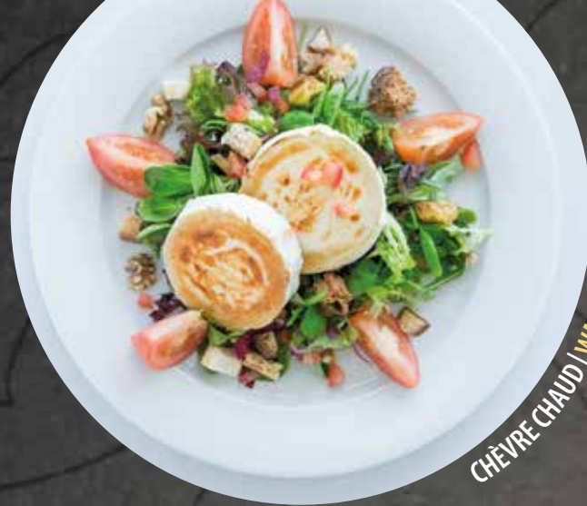
CHÈVRE CHAUD | WARMER ZIEGENKÄSE

Supplément poulet | Aufpreis mit Poulet 2.50